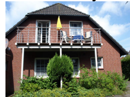
Krabbenweg 8b, 26736 Greetsiel